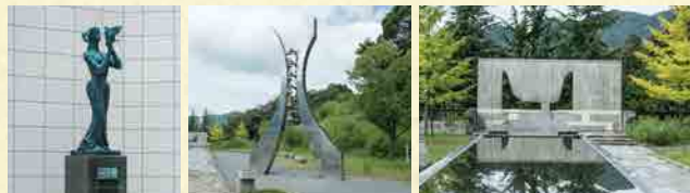
語らいの像 カリヨン 石のモニュメント

昭和45年(1970)、「岸壁の母」の舞台となった舞鶴引揚援護局跡地を見下ろす丘陵地に引揚記念公園が整備されました。公園には舞鶴引揚記念館が建設され、引揚棧橋を見下ろす展望広場には「平和の群像」や「異国の丘」「岸壁の母」の歌詞を刻んだ歌碑などが静かにたたずんでいます。