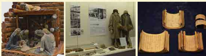
世界記憶遺産登録資料「白樺日誌」