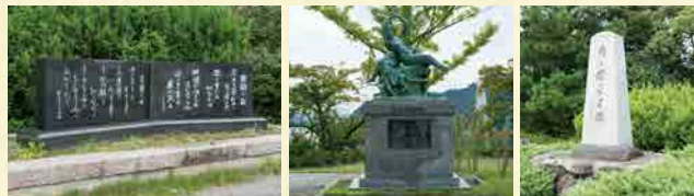
異国の丘・岸壁の母の歌碑 平和の群像 「あゝ母なる國」の碑